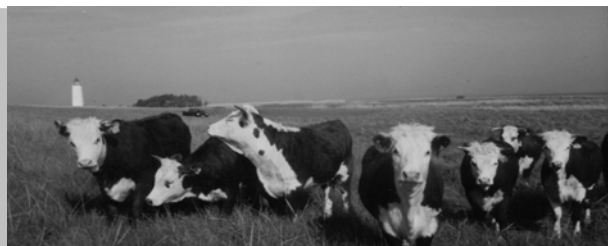
Foto: Nysgerrige kvier på Hyllekrog